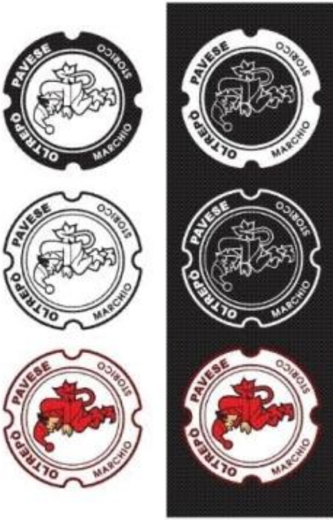
A colori su nero